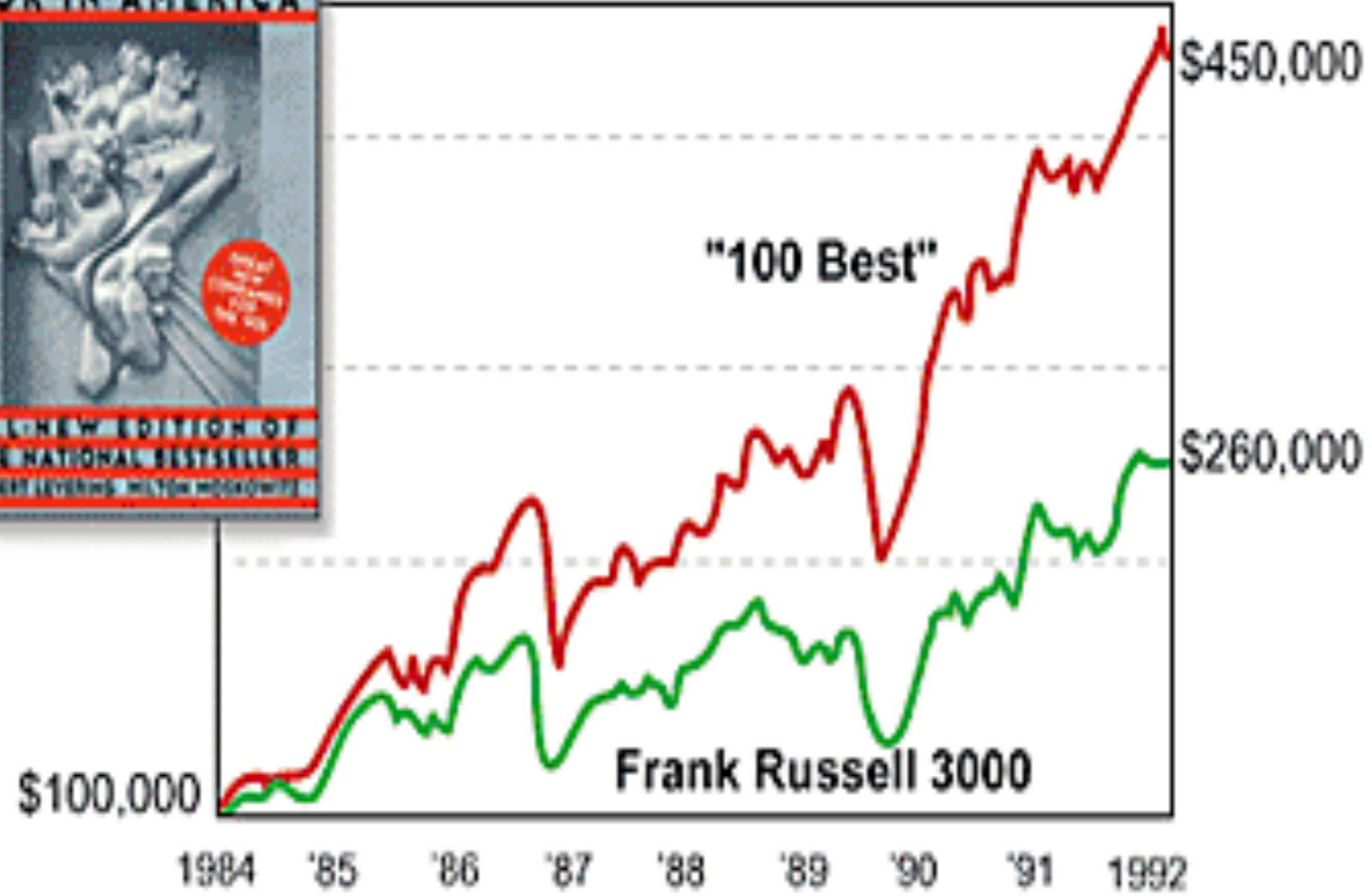
Total Return (equally weighted portfolios)