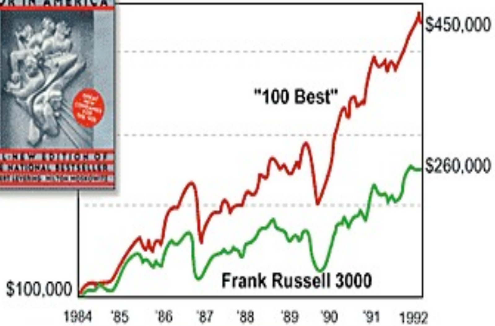
Total Return (equally weighted portfolios)