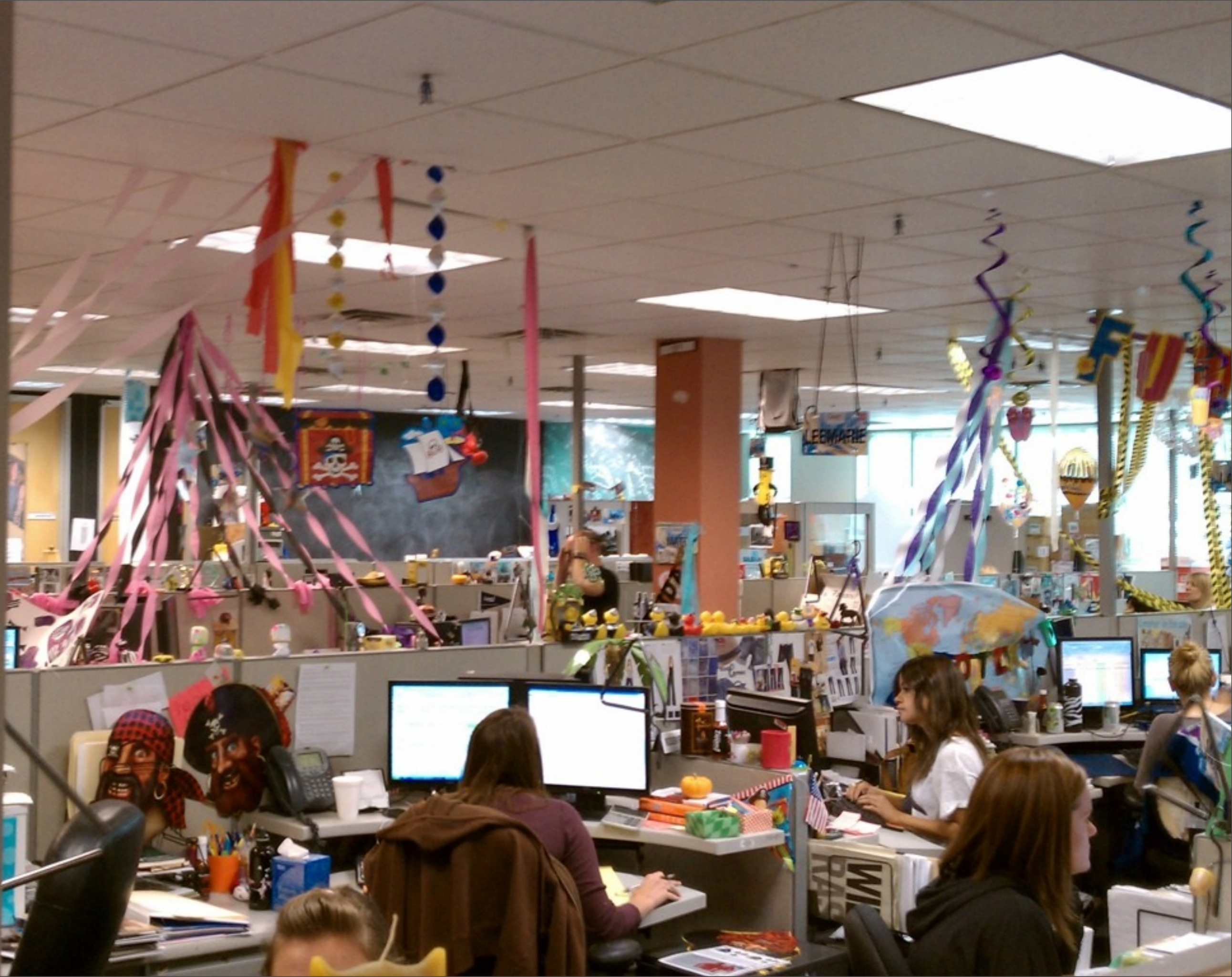
tirsdag den 5. februar 13